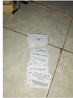
الصورة ٣. البطاقة "الحقيقة أو الجرأة" (Truth or Dare)

(٥) حدد نقد التي أخذها المجموعة البطاقة التي أخذها كل عضو في المجموعة. (٦) طلبت من كل عضو في المجموعة أن تأخذ بطاقة واحدة و وجب على السؤال أو الجرأة الموجود على البطاقة التي أخذها. (٧) كل مجموعة اللعبة نال قدر ٥ دقائق لاستعداد عن الأجابة و