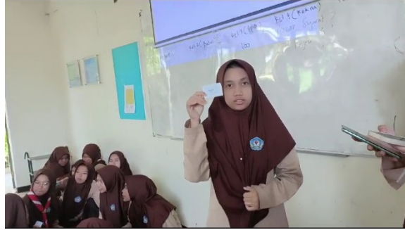
الصورة ٤. لعبة البطاقة "الحقيقة أو الجراًة" (Truth or Dare)

دقيقة ١ للإجابة على الأسئلة أو الجراًة. ٩) إذا كانت الإجابة صحيحة أو يمكن نجر في إجراء الجراًة فالجر لمجموعة الحصول على ١٠٠ نقطة، وإذا كانت الإجابة خاطئة أو لم ينجح من أداء الجراًة فسيتم خصم النقاط بمقدار ٥٠. لتحديد ترتيب اللعبة. يتم ذلك بطريق مسابقة الجري من وراء الفصل إلى أمام الفصل، و لسرع المجموعة التي تصل من المجموعة الأخرى إلى أمام الفصل فهي ستلعب اللعبة أولاً. و المجموعة التي تحصل على أكبر عدد من النقاط هي الفائزة في هذه اللعبة و سيحصل الهداية و من المجموعة الغالب.