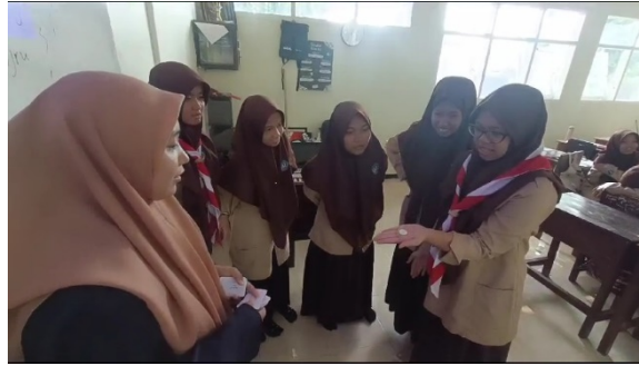
الصورة ٢. رمي النقد لتحديد نوع من البطاقة

(٤) و بعد ذلك بدأ في رمي نقد من المجموعة الأولى حتى الخامسة لتحديد نوع من البطاقة التي سيتم اللعب بها. إذا كان وجه النقد مكتوبا عليه "T" أو "الحقيقة" في الأعلى فتجب على المجموعة أن تأخذ بطاقة "الحقيقة" و بالعكس إذا كان وجه النقد مكتوب عليه "D" أو "الجرأة"، فتجب على المجموعة أن تأخذ بطاقة "الجرأة".